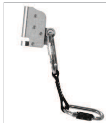
Anticaídas STOPCABLE sekuralt REF. 083078

Esta guía de cable tiene la misma función que la guía de cable estándar. Su diseño dispone de un gancho de seguridad para colocación en instalaciones en condiciones extremas.