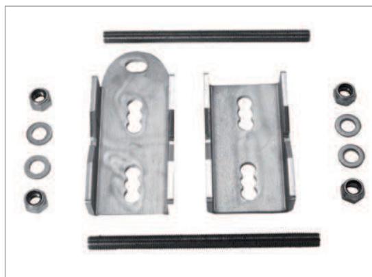
GUIA PESCANTE (superior) REF. 170001

Cable fabricado en acero inoxidable AISI 316, es un cable de 8mm con una estructura 7X19+0 y tiene una resistencia a la rotura máxima de 41,7kN. El cable se extiende por toda la longitud de la línea, y servirá como soporte para el anticaídas Stopcable, que directamente conectado al punto de anclaje externo del arnés.