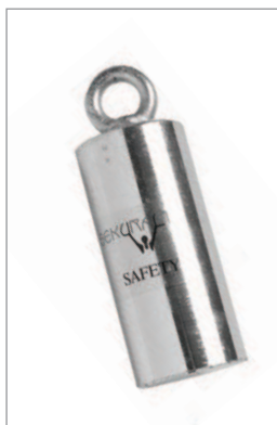
CONTRAPESO REF. 170026

La guía pescante es el soporte que sirve de unión entre el cable y la escalera. La guía pescante soporta todos los esfuerzos generados en caso de caída, y está certificado conforme a la norma EN 795 por el organismo APAVE con el nº de certificado 20301162