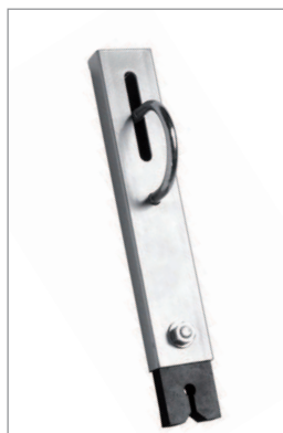
GUIA PARA CABLE REF. 170016

Tiene un peso de 7,5 kg. Se sitúa en la parte inferior de la línea de vida y realiza la función de mantener tensa la línea de vida.