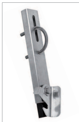
GUIA PARA CABLE CON GANCHO DE SEGURIDAD REF. 170019

Las guías para cable se deben utilizar en líneas de vida de longitudes superiores a 10 metros. Se abrazan a los peldaños de las escaleras y su principal misión es la de guiar el cable y servirle de apoyo en su recorrido.