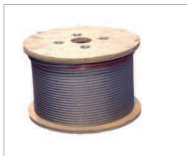
CABLE REF. 170013

Cable fabricado en acero inoxidable AISI 316, es un cable de 8mm con una estructura 7X19+0 y tiene una resistencia a la rotura máxima de 41,7kN. El cable se extiende por toda la longitud de la línea, y servirá como soporte para el anticaídas Stopcable, que directamente conectado al punto de anclaje externo del arnés.